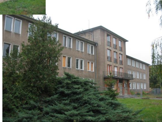
ADLERSHOF PROJEKT GmbH