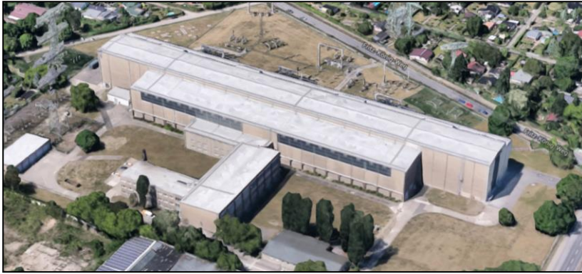
Google 3-D Bild auf das Gebäude